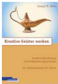
Kreative Geister wecken Kreative Ideenfindung