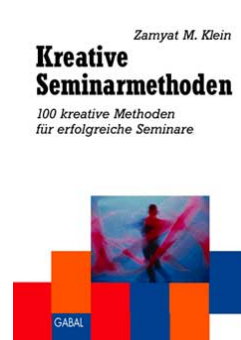
Kreative Seminar- methoden