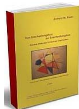
E-Book: Vom Ent- scheidungsfrust zur Entscheidungslust